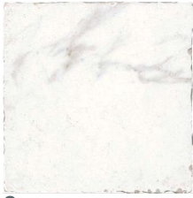
Carrara AP2071 • T165