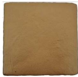
Fiebre del Oro MA1056 • T235