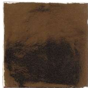
Gold HR0151 • T133