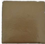
Aurum MA1055 • T235