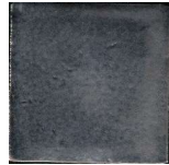
Metalizado MA1036 • T177