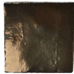
Oro brillo MA1053 • T235