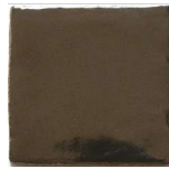
Bauxita MA1054 • T235