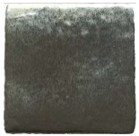
Acero MA1051 • T235