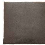
Ferro MA1052 • T235