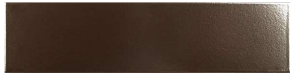
Platinum TM4003 ◊ T179