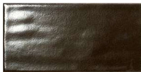
Platinum TM2003 ◊ T179