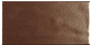
Copper TM2002 ◊ T179