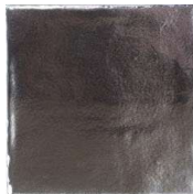
Antic Silver HR0152 • T133