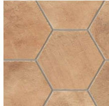
East NB2803 ◊ T133