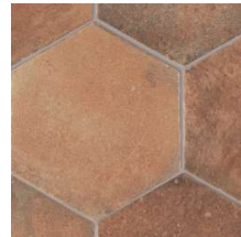
North NB4104 ◊ T090