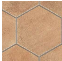
East NB4103 ◊ T090