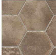
West NB2802 ◊ T133