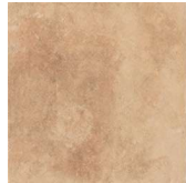
East NB3603 ◊ T063