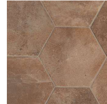
South NB2805 ◊ T133