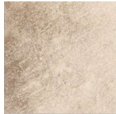
Downtown NB3601 ◊ T063