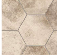
Downtown NB2801 ◊ T133