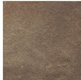
West NB3602 ◊ T063