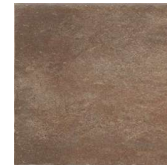
South NB3605 ◊ T063