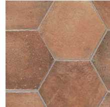
North NB2804 ◊ T133