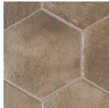
West NB4102 ◊ T090