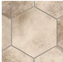
Downtown NB4101 ◊ T090