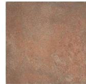
North NB3604 ◊ T063